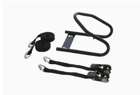
Moto Wheel Chock Front

Eenvoudig te monteren en te verwijderen dankzij het speciale installatie set.